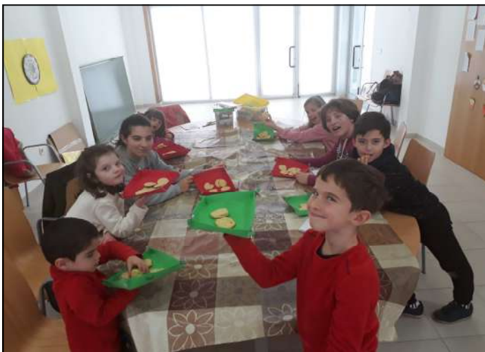
ACTIVIDADES DO NADAL

Deixamos algunhas imaxes das actividades que organizou o concello este Nadal e do Entroido.